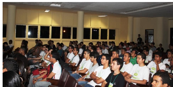
As imagens são registros de alguns dos momentos das edições anteriores!

Uma grande diversidade de atividades marcou esses 6 anos de SEMCOMP, além de uma enorme carga de conhecimento compartilhado com os participantes através das palestras e cursos, foram realizados workshops , competições entre startups , coding-dojos e muito mais.